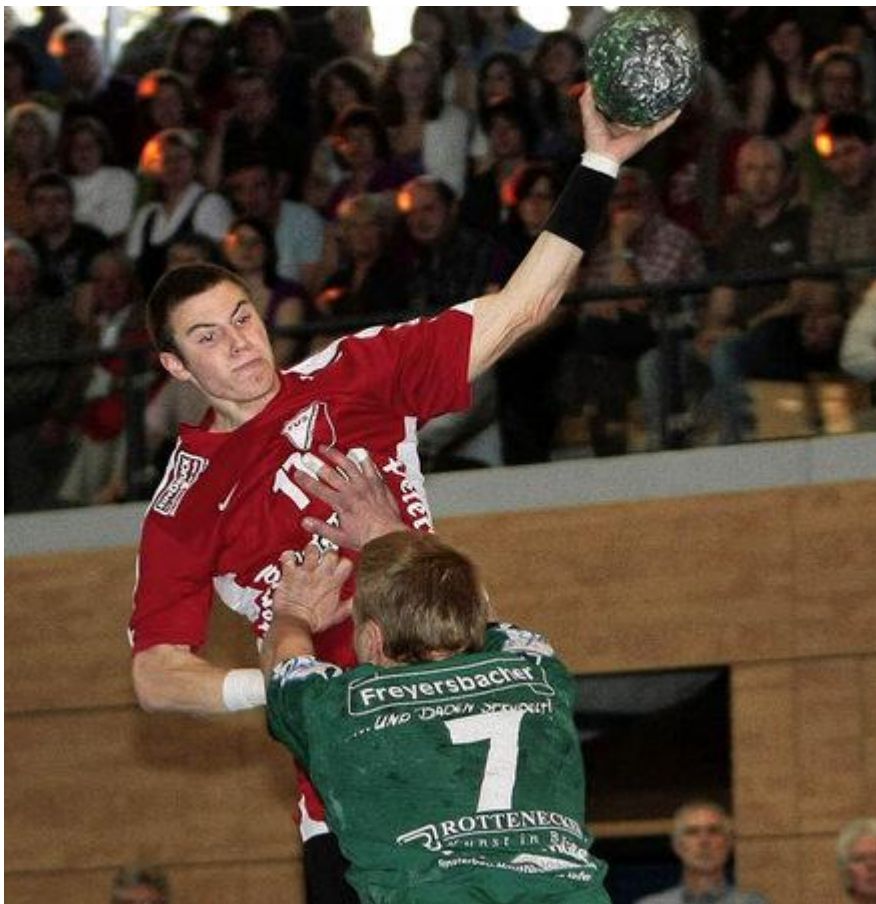
Das Stoßen gegen Spieler, die im Sprung sind, soll künftig härter bestraft werden.